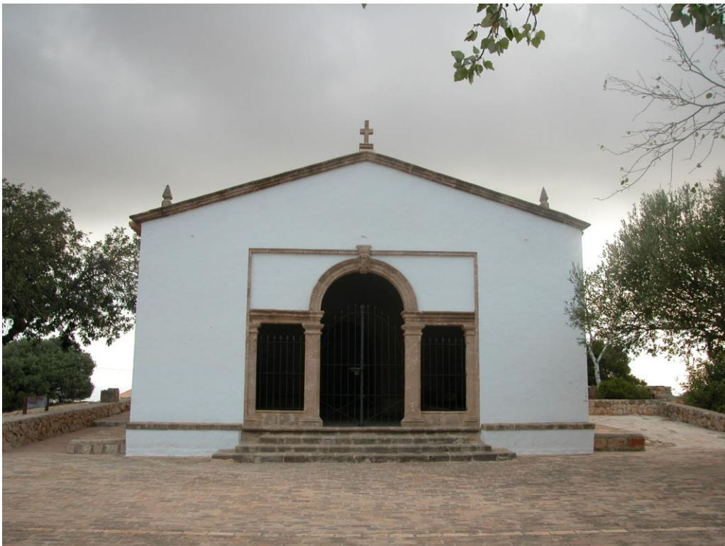
FOTO 4. ERMITA DE SANT JOAN. FACHADA SUR.