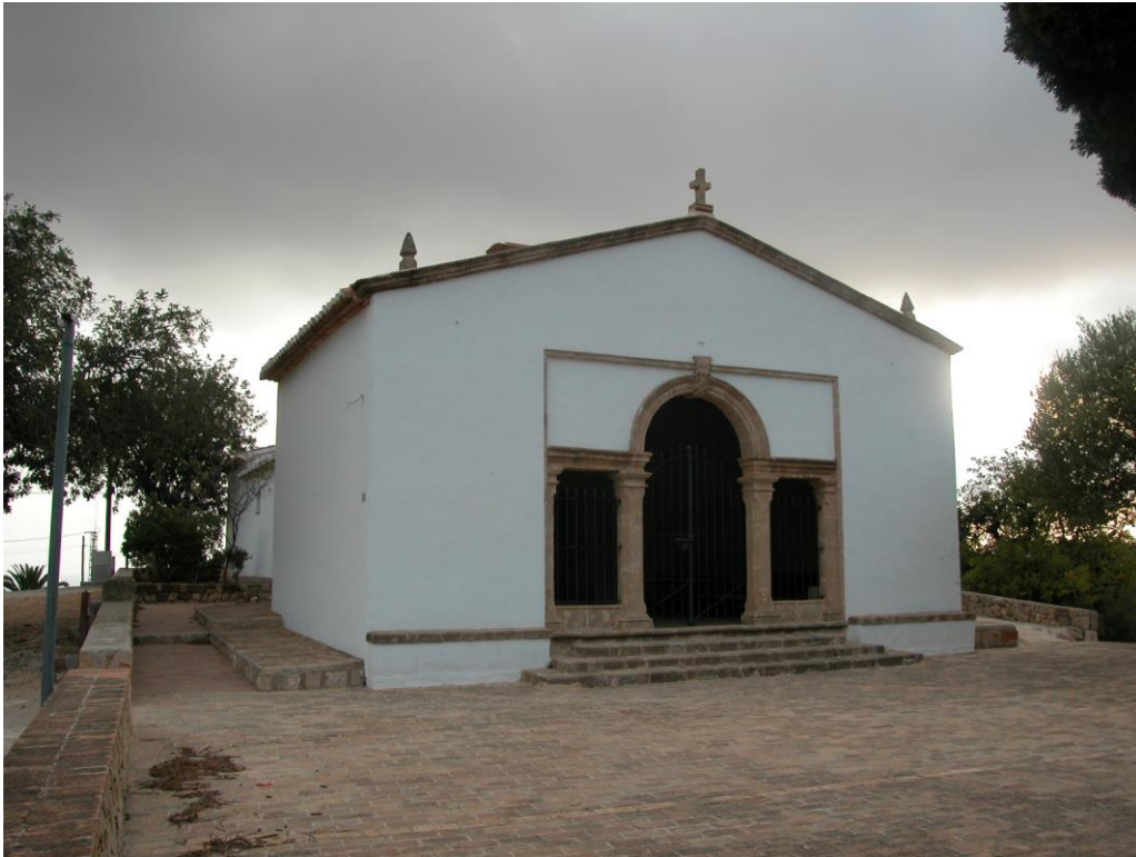
FOTO 3. ERMITA DE SANT JOAN. FACHADA SUR.