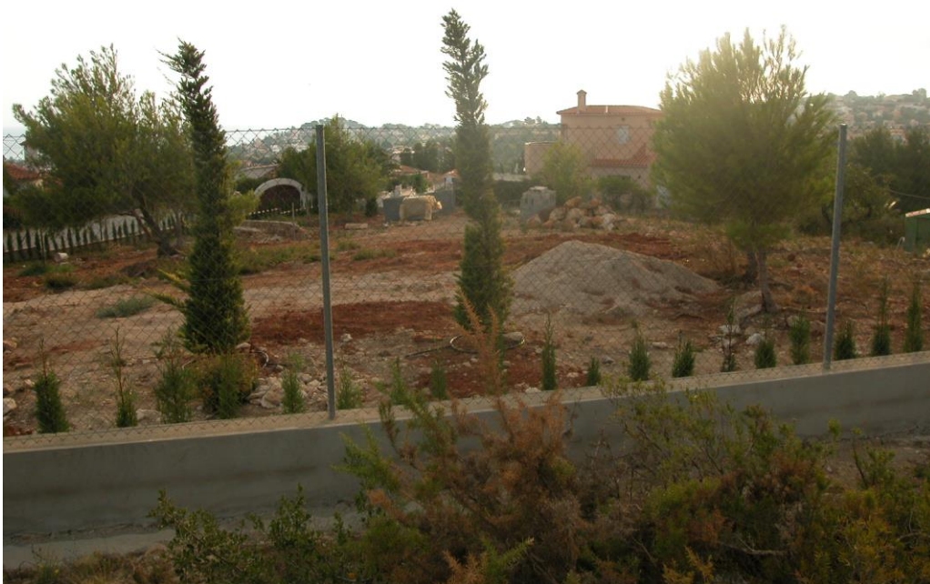
FOTO 8.- ERMITA DE SANT JOAN. ENTORNO RECIENTEMENTE DEGRADADO.