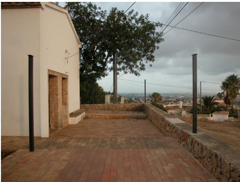
FOTO 6. ERMITA DE SANT JOAN. FACHADA NORTE.