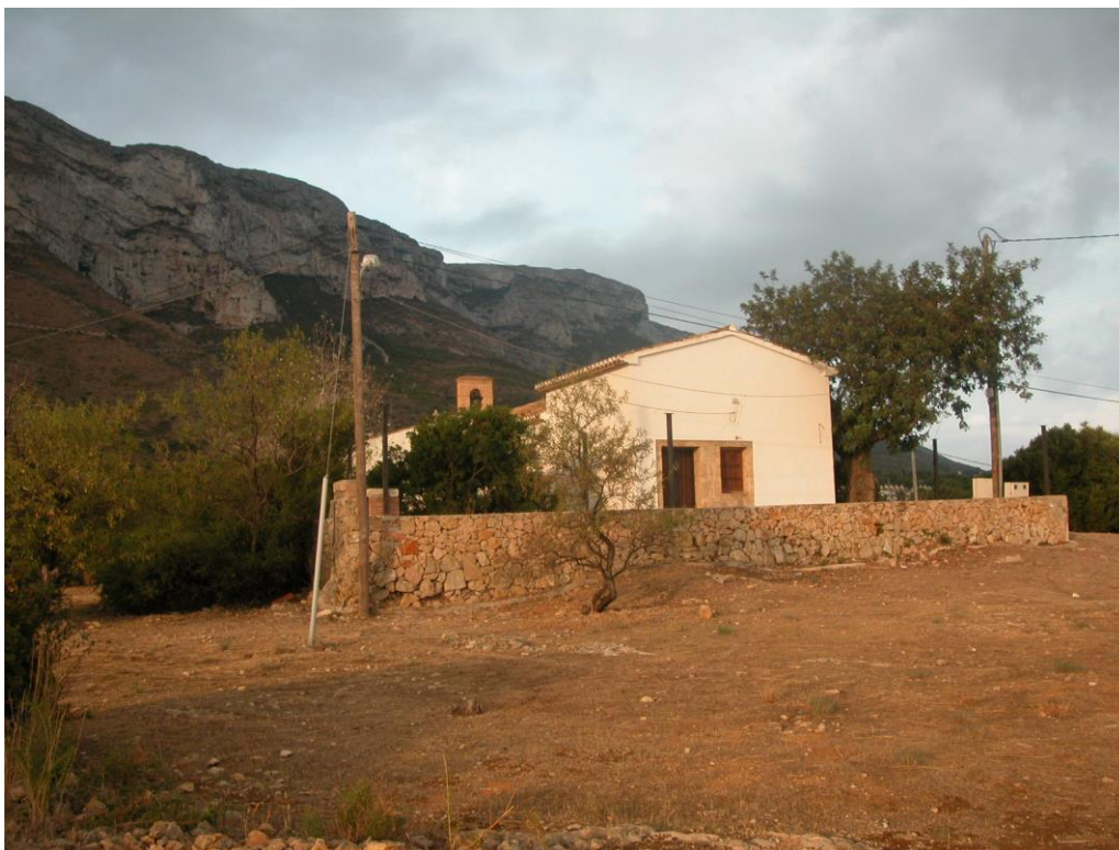
FOTO 5. ERMITA DE SANT JOAN. FACHADA NORTE.