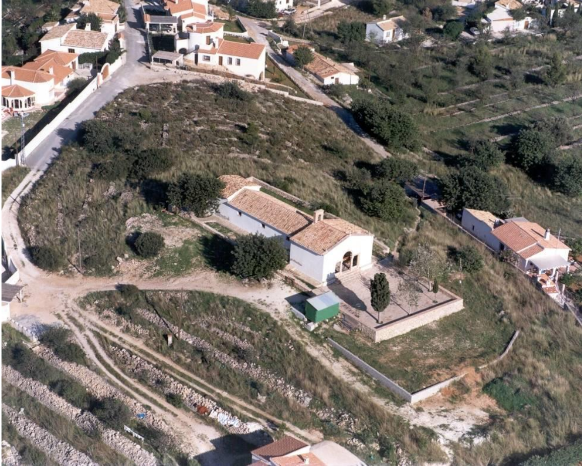
FOTO 1. VISTA AÉREA DE LA ERMITA Y SU ENTORNO. (En la actualidad recientemente transformado)