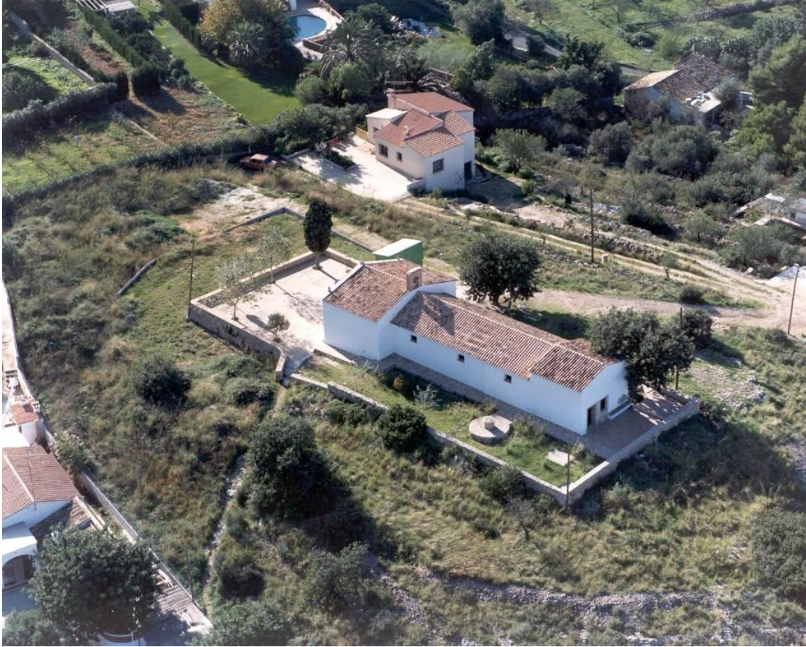
FOTO 2. VISTA AÉREA DE LA ERMITA Y SU ENTORNO.