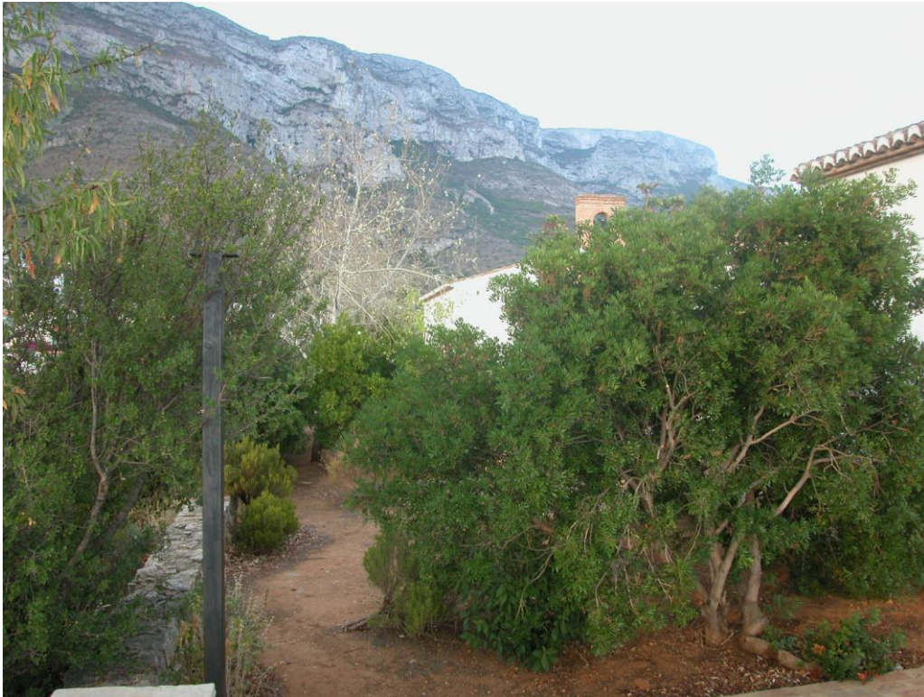
FOTO 7. ERMITA DE SANT JOAN. ENTORNO CON VEGETACIÓN AUTÓCTONA DESBORDANTE.