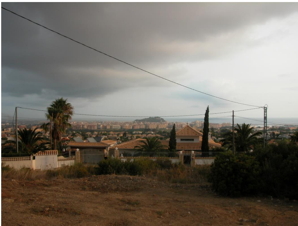
FOTO 9. VISTA DE DÉNIA DESDE LA ERMITA DE SANT JOAN.